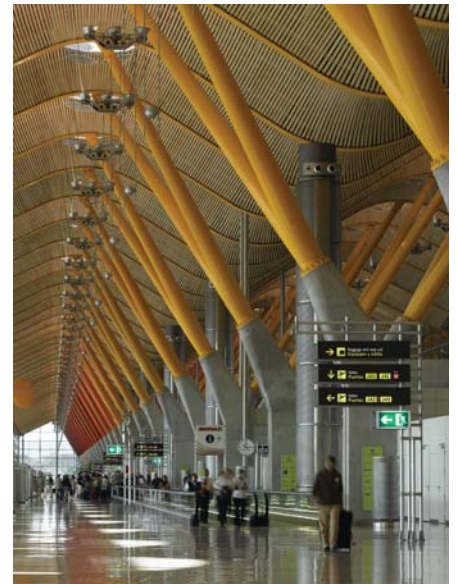
Barajas Airport, Madrid