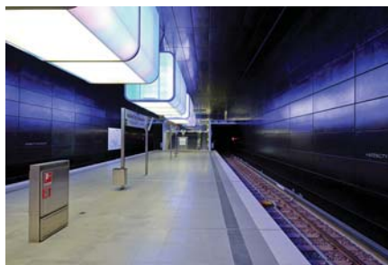
U4 - Haltestelle HafenCity Universität