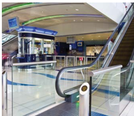
Dubai Metro - Red Line / Green Line