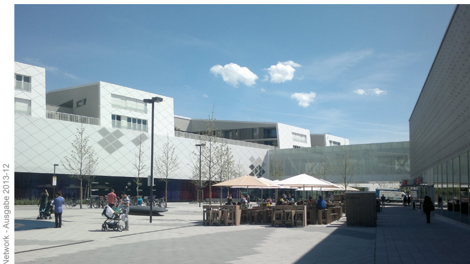
Network - Ausgabe 2013-12